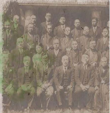
高津町・川崎市合併時の記念撮影