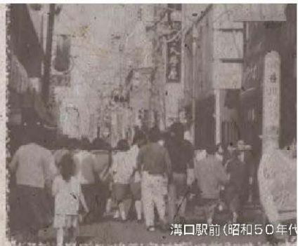
溝口駅前(昭和50年代)