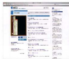
「新書マップ」の画面。

現在のデータベースは全10件。検索したいデータベースにチェックを入れて検索すると、それぞれのデータベースが選んだ書籍が表示される。