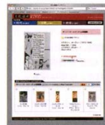
「文化遺産オンライン」の画面。